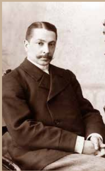
Самым громким в начале XX века оказалось дело барона Константина Платоновича Фредерикса.