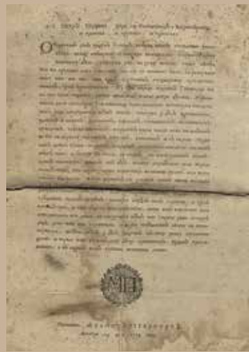
Указ Петра Первого 1714 г.